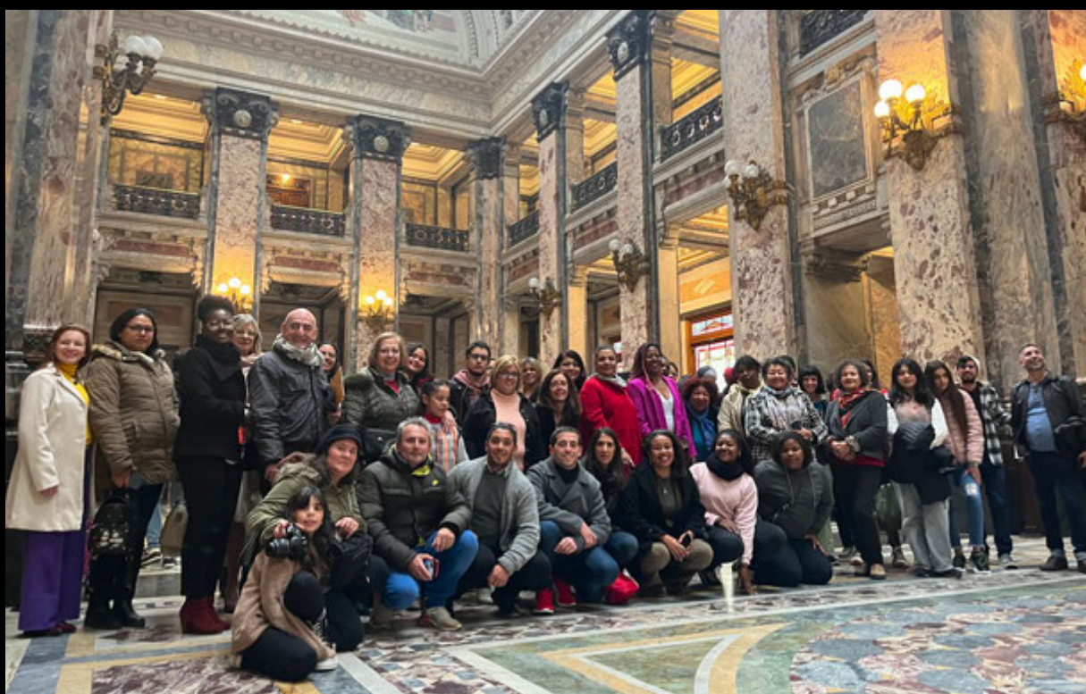
En ocasión de la exposición en el Parlamento de la República.